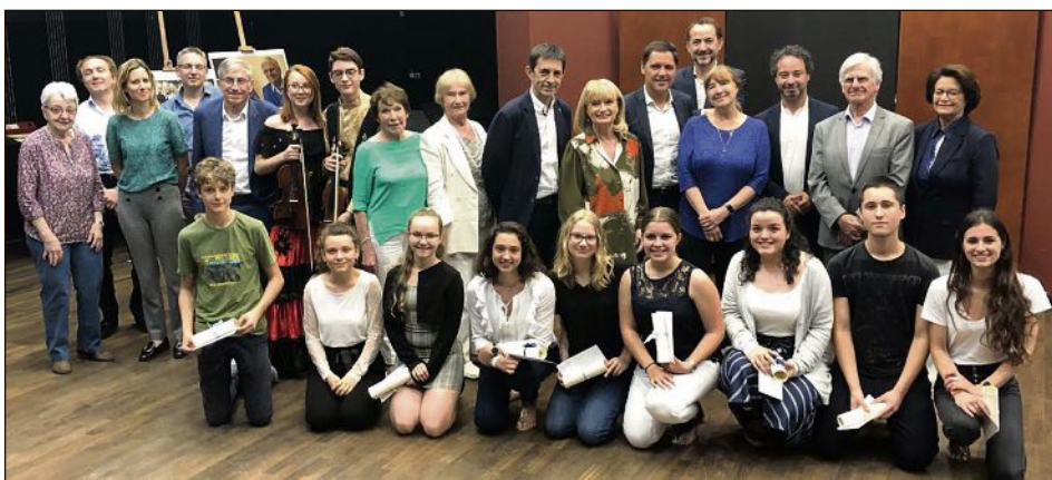
Les jeunes musiciens de « Sympho New » récompensés et les personnalités.