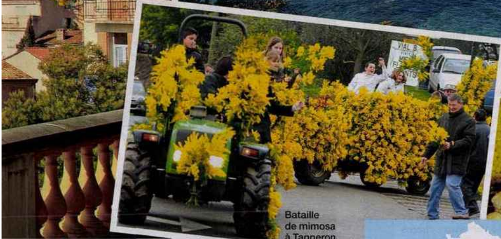
Bataille de mimosa à Tanneron.

Pour acheter du mimosa, rendez-vous chez les horticulteurs, ou « mimosistes », qui possèdent des forceries, chambres où l'on fait fleurir le mimosa encore vert. Certaines se visitent.