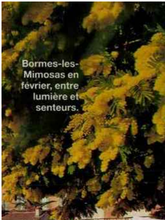
Bormes-les-Mimosas en février, entre lumière et senteurs.